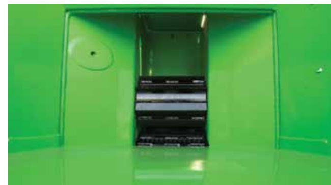
Входное окно 230 x 230