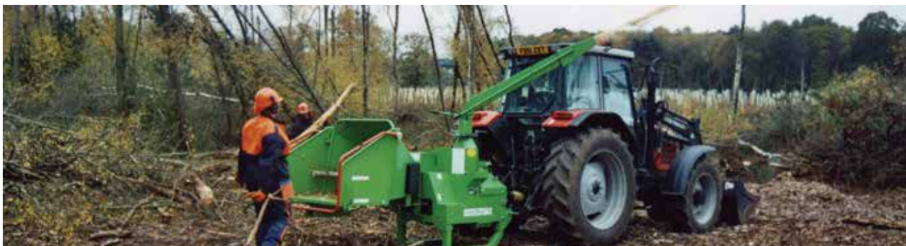
Мощный выброс, высокая производительность Монтируется на трактора от 60 л.с.