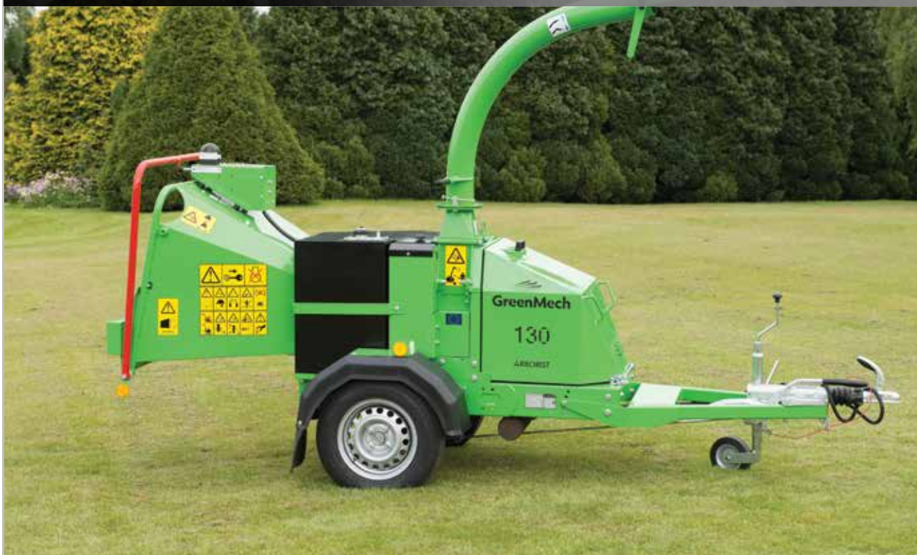
Крепкая рама, удобная компоновка Измельчение до 150 мм