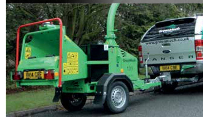
Гомологирован для транспортировки