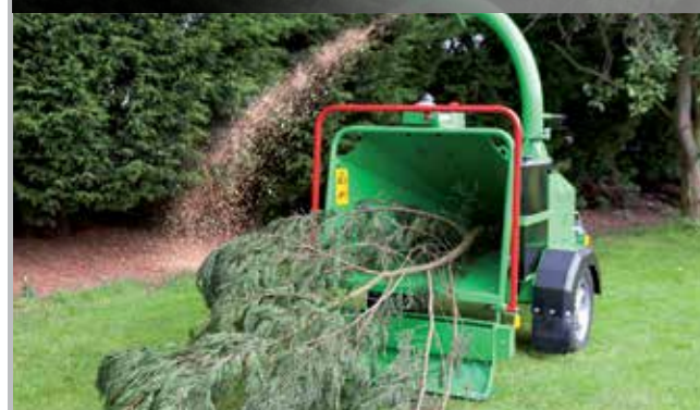
Мощный выброс, удобная планка антипаники