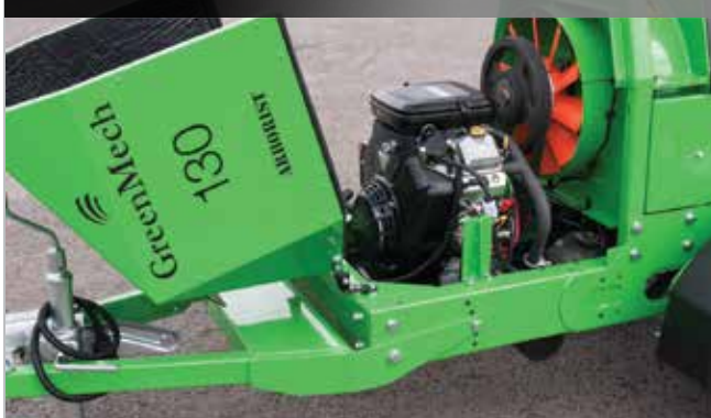
Удобный доступ для обслуживания