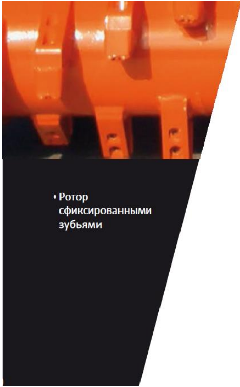
• Ротор с фиксированными зубьями